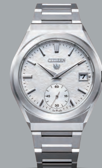
NEW NC1001-58A ¥880,000 (税抜価格 ¥800,000) 特定店限定モデル