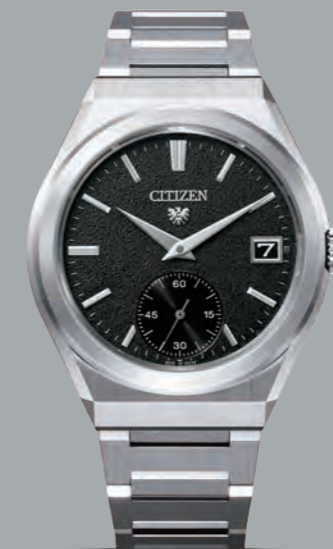
NEW NC1000-51E ¥880,000 (税抜価格 ¥800,000) 特定店限定モデル